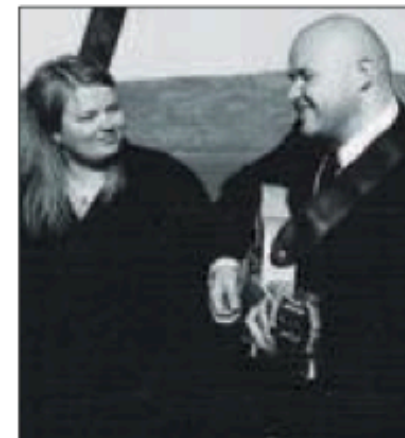
JAZZ... smidd i hymens lenker.